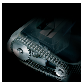
CATENA robusta trasmissione a catena e ingranaggi in acciaio