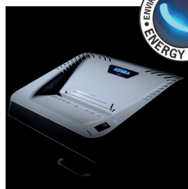
ENERGY SMART® Sistema di gestione energia a indicatori ottici luminosi ENERGY SMART® per il risparmio di energia in modalità stand-by