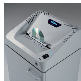
AUTO START & DISTRUZIONE CD Avviamento e spegnimento automatico a fotocellule. Flap integrato per la distruzione di CD, DVD, Floppy-Disk e carte di credito