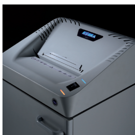
INDICATORI A LED Comando di azionamento intuitivo, con visualizzazione a LED per sacco pieno e porta aperta

SUPER POTENTIAL POWER UNIT robusta trasmissione a catena con ingranaggi in acciaio FUNZIONAMENTO CONTINUO 24 ore su 24 senza surriscaldamento e senza cicli di lavoro COLTELLI IN ACCIAIO non danneggiabili da punti metallici e graffette ENERGY SMART® sistema di risparmio di energia in stand-by START & STOP avviamento e spegnimento automatico a fotocellule SAFETY STOP stop automatico con segnalazione luminosa sacco pieno e/o porta aperta AUTOMATIC REVERSE sistema anti-inceppamento: ritorno automatico del materiale inserito in caso di intasamento MOBILE elegante mobile da 110 litri montato su ruote girevoli